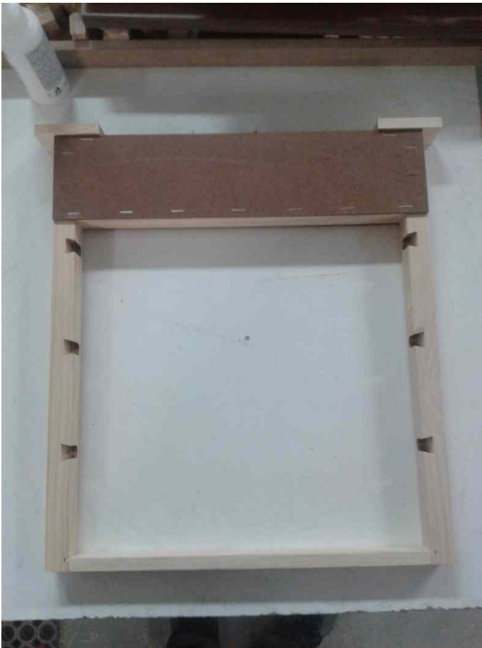
Cuadro Dadant con alimentador y dos listones.